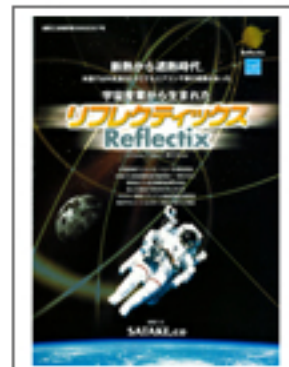
断熱から遮熱の時代 リフレクティックス