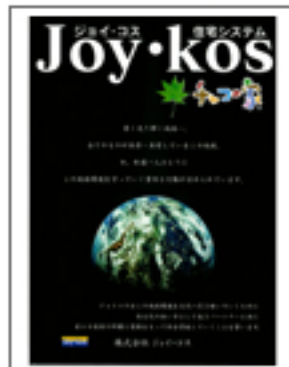
ジョイ・コス住宅システム 「チャコの家」