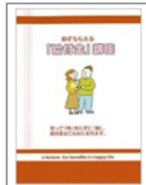
必ず貰える 「給付金」講座