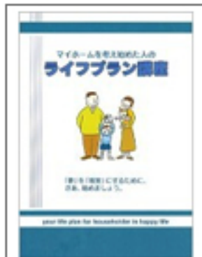
マイホームを考え始めた人の ライフプラン講座